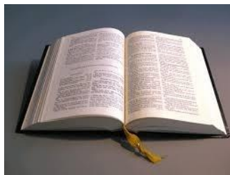
Ein stärkendes Wort aus der Bibel