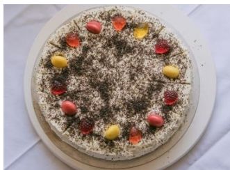
Von Meisterhand gezauberte Torten