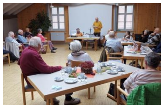
Eine fröhliche Gemeinschaft